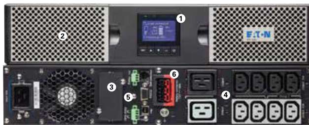
Eaton 9PX 3000 VA