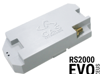
RS2000 EVO ZEUS