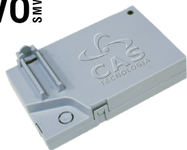
RS2000 EVO SMM