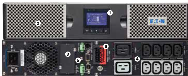
Eaton 9PX 3000 VA